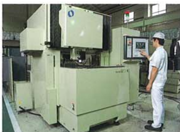
水中ワイヤー放電加工機 Submerged Wire Electric Discharge Machine