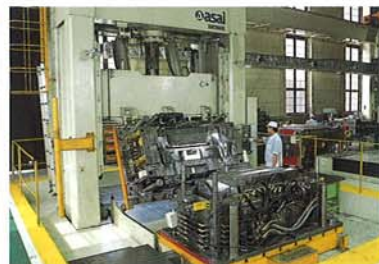
ダイスポットマシン Die Spotting Machine