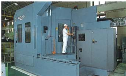
大型高速マシニングセンター Large, High-speed Machining Center