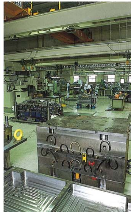
仕上場 Finishing Operation