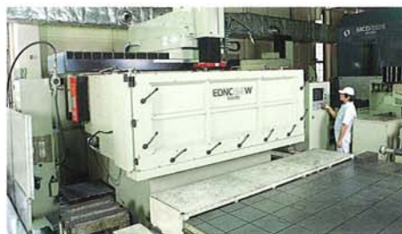
NC放電加工機 NC Electric Discharge Machine