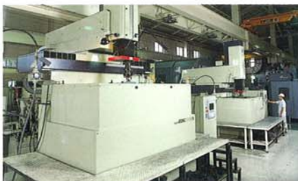
磨きレス放電加工機 Polish Electric Discharge Machine